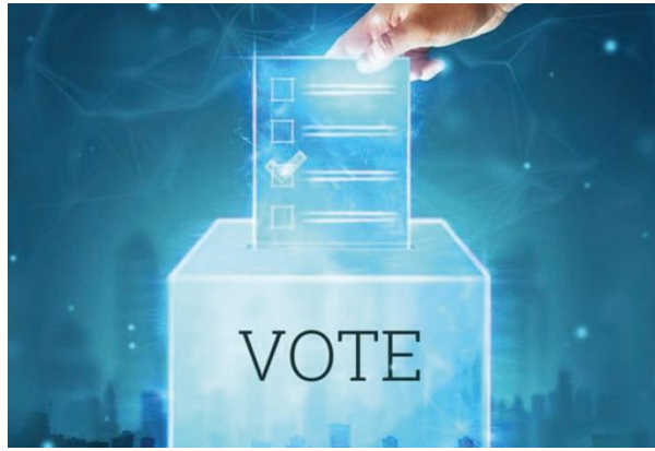
PANAMERICANO A LAS URNAS